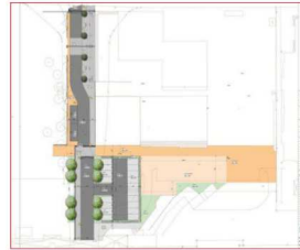
Marktplatz 1. BA