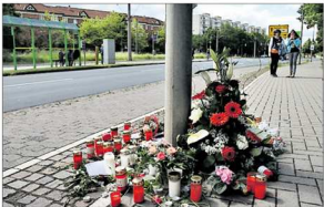
Mit Kerzen und Blumen am Haltestellenschild Laatzten gedenken Mitschüler, Freunde und Verwandte der beim Unfall getöteten Neunjährigen.

Erich-Panitz-Straße: Nach tödlichem Unfall suchen Stadt und Bürger nach Lösungen – Unfallkommission tagt bald